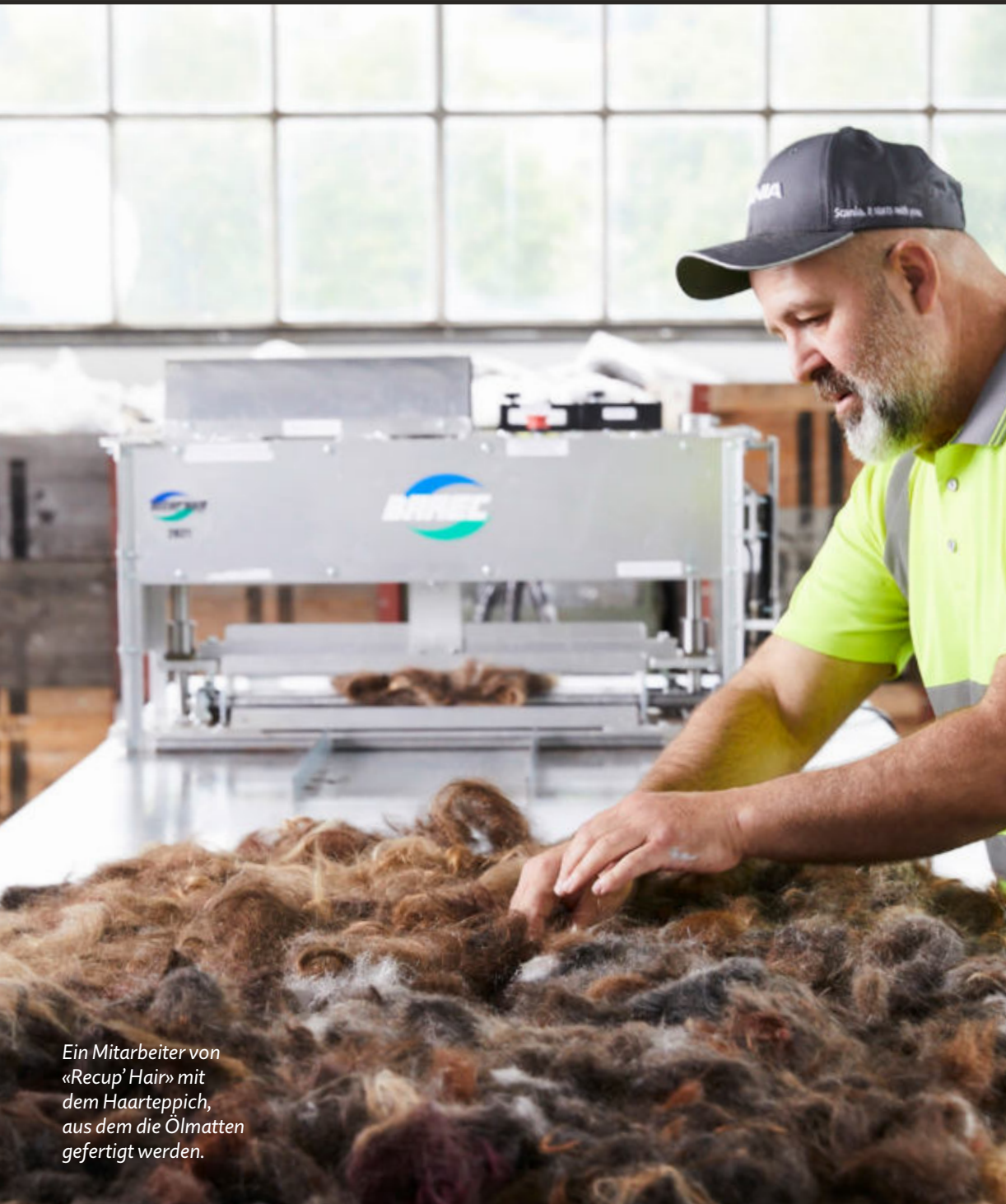
Ein Mitarbeiter von «Recup' Hair» mit dem Haarteppich, aus dem die Ölmatten gefertigt werden.